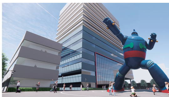
© 光プロ / KOBE 鉄人 PROJECT2022

新病院では、市街地西部の中核病院として、「まもる：市民の生命と健康を守る」、「つなぐ：地域医療と地域社会をつなぐ」、「はぐくむ：まちとひとを育む」という考え方のもと、「救急医療、感染症・災害医療の強化」、「地域包括ケアシステムの推進」、「まちづくりや地域活性化に寄与」という3つのコンセプトを掲げ、急性期医療の中心的役割を担うだけでなく、市街地西部において住みたくなるまちのシンボルとなるような病院を目指します。