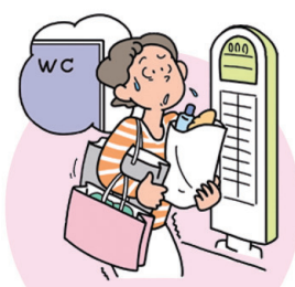
トイレが近い (頻尿)