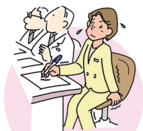
がまんできない尿意 (尿意切迫感)