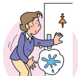
トイレまでがまんできず、 尿がもれる (尿失禁)

重い物を持つ、くしゃみ、 笑うなどの際、尿がもれ ることがある (腹圧性尿失禁)