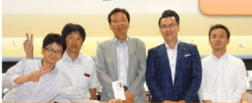
2位 総務課「スター天ちゃん」